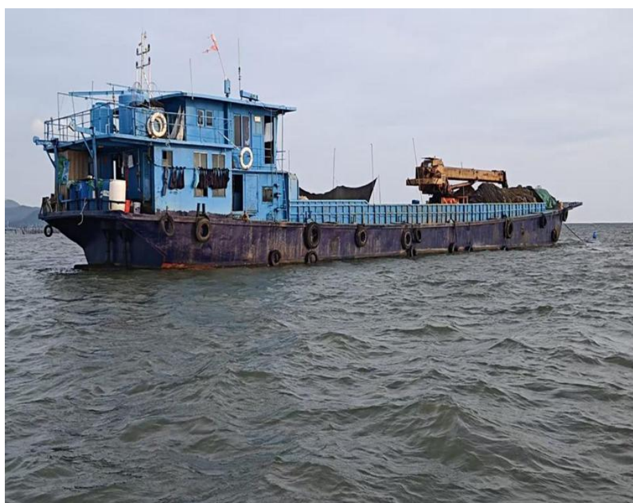
图 3 工作船